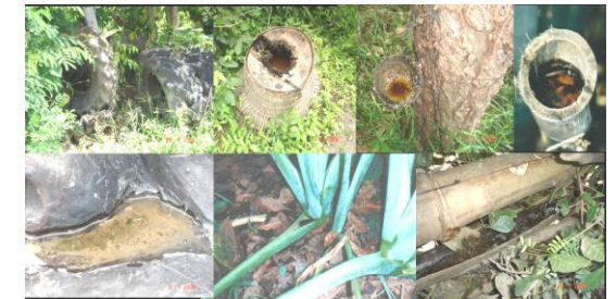
แหล่งเพาะพันธุ์ยุงลายสวน

ยังไม่มีการรักษาจำเพาะสำหรับโรคชิคุนกุนยา วิธีที่ดีที่สุดขณะนี้ คือการรักษาตามอาการและการรักษาแบบประคับประคองเช่น ให้กินยาพาราเซตามอลเพื่อลดไข้ (ห้ามกินยาแอสไพรินลดไข้เป็นอันตรายเนื่องจากจะทำให้เกิดเลือดออกได้ง่ายขึ้น)รวมทั้งการเช็ดตัวด้วยน้ำสะอาดเป็นระยะเพื่อช่วยลดไข้กินยาเพื่อลดอาการปวดข้อดื่มน้ำและพักผ่อนให้พอเพียง