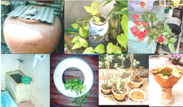
แหล่งเพาะพันธุ์ของยุงลายบ้าน

การใช้ทรายกำจัดลูกน้ำ ใช้ใส่ในน้ำเพื่อกำจัดลูกน้ำยุงลาย อัตราส่วนที่แนะนำให้ใช้คือ ทรายกำจัดลูกน้ำจำนวน 1 กรัมต่อน้ำ 10 ลิตร แม้ว่าทรายกำจัดลูกน้ำจะมีความปลอดภัยสูงต่อคนและสัตว์ แต่ทรายกำจัดลูกน้ำก็มีราคาค่อนข้างสูง นอกจากนี้ยังหาซื้อได้ยากในท้องตลาด ดังนั้น ควรใส่ทรายกำจัดลูกน้ำเฉพาะในที่ที่จำเป็นจริงๆ เท่านั้น