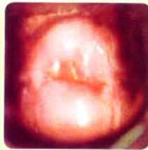
Parous เคยคลอดบุตร