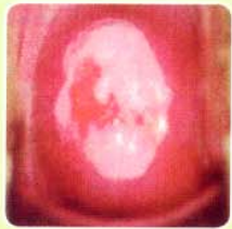
Large, thick, dull acetowhite lesion ก่อนการจี้เย็น