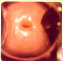
4 months after หลังจากจี้เย็น 4 เดือน

สตรี ที่ควรได้รับการตรวจหาความผิดปกติของปากมดลูกโดยวิธีใช้น้ำส้มสายชู