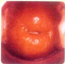
Inflammation ปากมดลูกอักเสบ