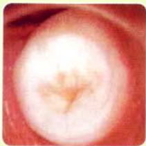
Immediately after หลังการจี้เย็นทันที