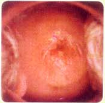
Squamous metaplasia แผลปากมดลูก