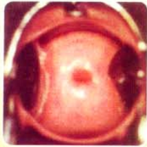
Nulliparous ไม่เคยคลอดบุตร